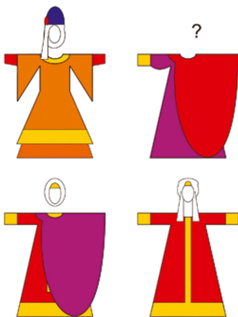
фиг. 8. Женското киторско облекло от Светославовия Изборник, съпоставено с такива от Кодекса на Гертруда и Киевския събор.