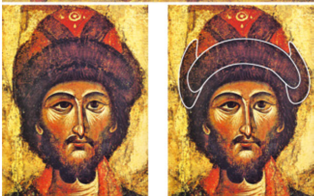
фиг. 5. Свети Борис и Греб. Икона от Киев, XII-XIII в. Долу: детайл от шапката на свети Борис.

времето. В Менологията поне един от българските кафтани е представен като луксозен [Атанасов 1999, 198]. Що се отнася до коланите с вертикални ремъци, такива са употребявани от българите от езическия период, а според някои данни и през X в. [Инкова 2004; Минаева 2012, 49-66].