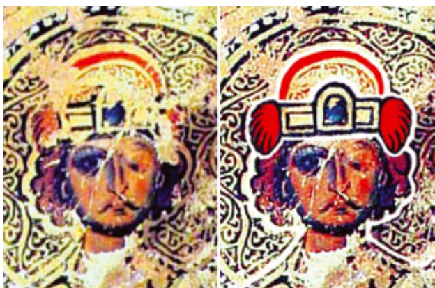
фиг. 3. Свети Борис, Учително евангелие. Репродукция и възстановка по А. Стойков [Стойков 2021, 70].

и то през периода, в който вече носи титлата цар. В този случай изключително смущаващ е недостигът на властови символи: пурпурно наметало с таблони, червени ботуши и особено липсата на короната с пропендули, известна от печатите му. Остава възможността Светославовият сборник да е преписан не непосредствено от Симеоновия, а от негово украсено копие (тезата за такива копия е изказана от Н. Мавродинов [Мавродинов 1955, 32-34] 4 , съдържащо не-царски ктиторски портрети. Хламидов костюм трябва да е употребяван от българската аристокрация скоро след покръстването, след като според Клиторология на Филотей от 899 г. българските пратеници в Константинопол биват приемани в собствените им хламиди [ГИБИ 1961, 121-128]. Като аргумент в полза на тази теза може да се посочи миниатюрата със „свети Борис“ в Учителното евангелие, където е изобразена фигура също в хламидов костюм и с шапка, на практика еднаква с тази от Светославовия сборник, но предадена с повече подробности и украса (фиг. 3). Смята се, че е изобразен бащата на Симеон Борис-Михаил, според Г. Атанасов представен с кесарски инсигнии [Атанасов 1999, 57-62]. Изобразеното украшение за глава включва диадема с голям челен скъпоценен камък, поставена върху полукръгла шапка с две космати „туфи“ отстрани. Двете изображения биха могли да представят една и съща българска реалия (т.е. аристократична мъжка шапка с кожен натилник /наушници), допълнена при княза със скъпоценен венец.