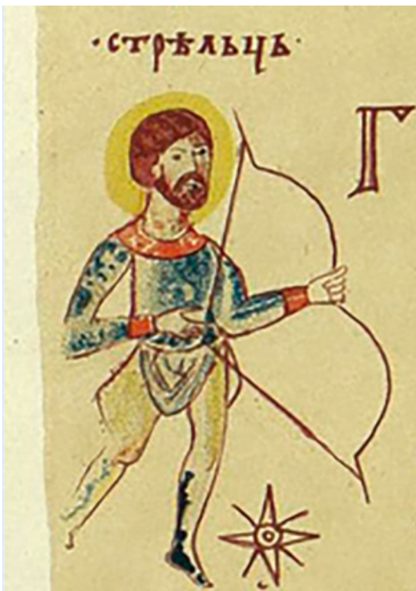
фиг. 11. Стрелеца от Светославовия Изборник.

275-277]. Същото се отнася за полукръглата яка и пристягането в кръста. Веднъж приемайки византийски произход на дрехата, такъв лесно може да се открие и за забраждането – начинът на увиване на воала около главата, с минаване под брадата и с един край, падащ от страни на лицето, среща аналогии в Менология на Василий II (976 - 1025), където, както и в Рус, се носи върху украсена шапчица. Не е изключено и ктигорката на Изборника да носи такава (фиг. 10) 15 . Налага се изводът, че дамата е облечена изцяло във византийски стил и че мъжката шапка над главата ѝ е някаква форма на грешка. Византийска мода в българския аристократичен женски костюм от X в. и в руския такъв от XI в. е еднакво резонна. В случая обаче наличието ѝ слабо осветява въпроса за собствено българското женско облекло от Първото царство. Образът на ранносредновековната българка остава все така тайнствен.