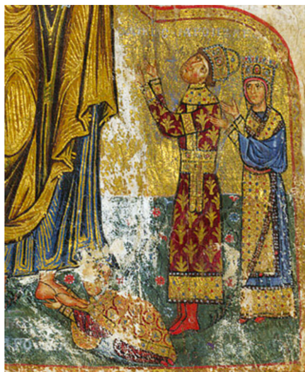
фиг. 4 . Ярополк и Гертруда пред свети Петър, Кодекс на Гертруда, лист 5v.