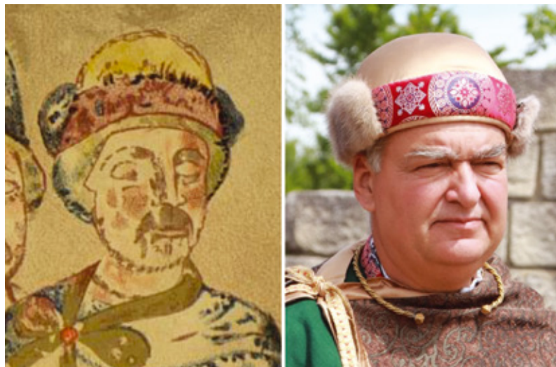
фиг. 1. Ктиорът от Светославовия Изборник. Вляво – репродукция по [Морозов 1880]; вдясно – реконструкция на Жасмин Първанов.

Ктиорът носи особена кожена шапка с двуцветна околожка (вероятно с обърнат нагоре натилник, тип ушанка) (фиг. 1) 1 . Наметнат е с хламида, закопчана на дясното рамо по византийски маниер. Могат да се посочат руски аналози от XI в. на този костюм. По подобен, но значително по-пищен начин е изобразен Ярополк, племенник на Светослав, в т. нар. Кодекс на Гертруда от 1078-1087 г. (фиг. 2) 2 . На миниатюра на лист 10v Ярополк получава от Христос корона с полукръгло текстилно дъно, обсипана с бисери и скъпоценни камъни; богато украсената и подплатена с кожи хламида е закопчана на дясното му рамо. Очевидно и в двата случая е следван византийският образец, като само украсата за глава е нетипична, с високо текстилно дъно. Семплото облекло на ктиора от Изборника може да се обясни с това, че Светослав, за разлика от Ярополк, не е бил провъзгласяван за владетел от папата. Хламидов костюм и кожена шапка (различна от тази на Светослав) носи и княз Ярослав Новгородски на портрет в църквата Спас-Нередици от 1198 г. 3 , така че облеклото спокойно може да се приеме за ранен представител на устойчива руска традиция.