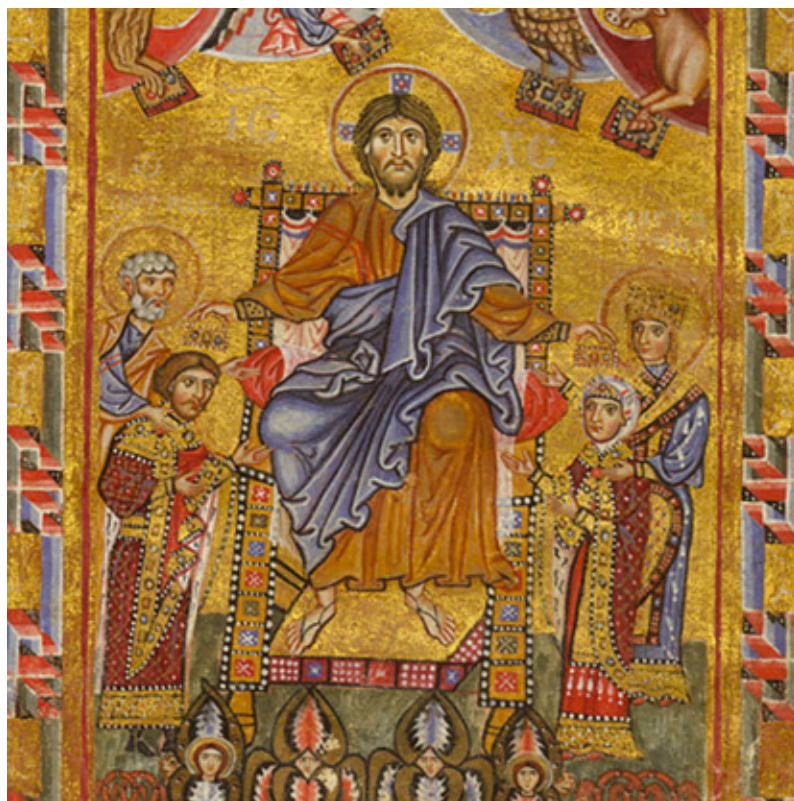
фиг. 2. Ярополк и Кунигунда пред Христос, Кодекс на Гертруда, лист 10v.