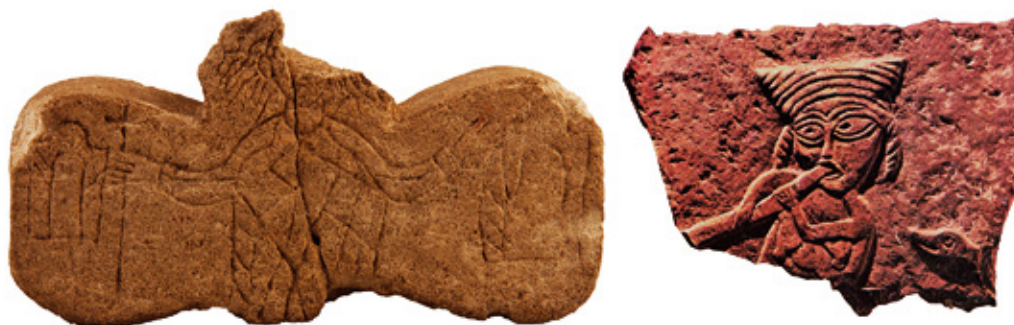
фиг. 9. Български ранносредновековни женски изображения. Вляво: надгробен камък от Плиска; вдясно – релеф от Нова Загора.

– фреските в Киевския събор „Св. София“, построен според източниците в 1017 или в 1037 г., при княз Владимир, покръстител на Рус, или при сина му Ярослав Мъдри. Двамата са съответно дядо и баща на Светослав от едноименния сборник. Фреските са изпълнени от константинополски майстори и са уникални със своите сюжети, сред които са включени представления на хиподрума в Константинопол и коронация на владетелка. Поводът е вече споменатата сватба на княз Владимир за ромейската принцеса Ана [Никитенко, Семенцова 1996]. Частично е запазен групов портрет на княжеско семейство. Съществуват различни версии не само за идентификацията на тези фигури, но дори и за пола им 13 . Три от тях но-