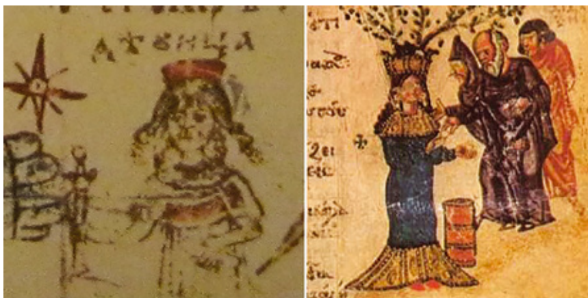
фиг. 13. Рисунка на Девата от Светославовия Изборник, съпоставена с изображение от Хлудовския псалтир.