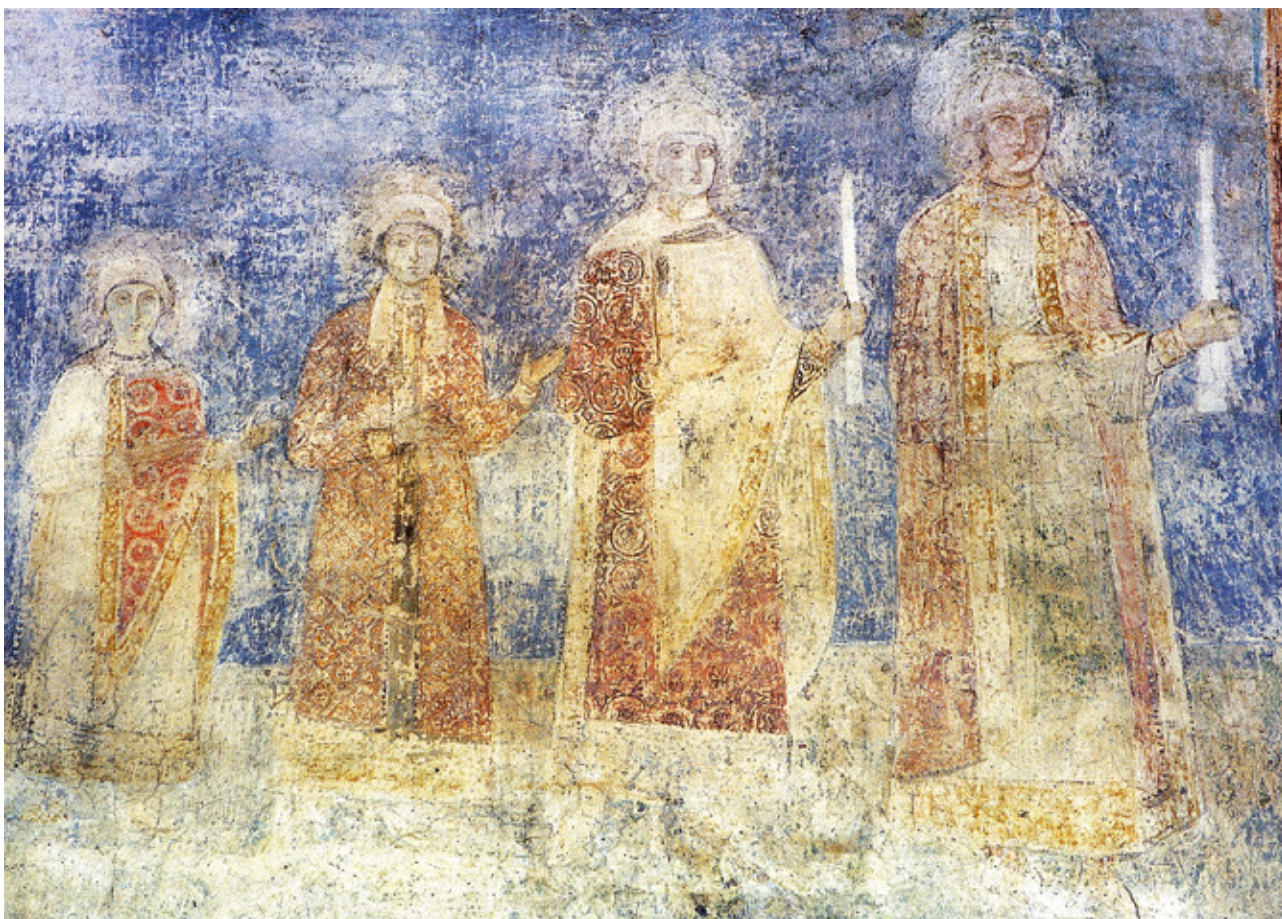
фиг. 7. Ктиторска процесия от Киевския събор.

менни на тях или архаични. Ролята на такива реални в портрет на Светослав би била да подчертае връзката му със светите чичовци, а може би дори и тази с неговия предтеча и съименник, превзел през 968 г. българската столица Преслав.