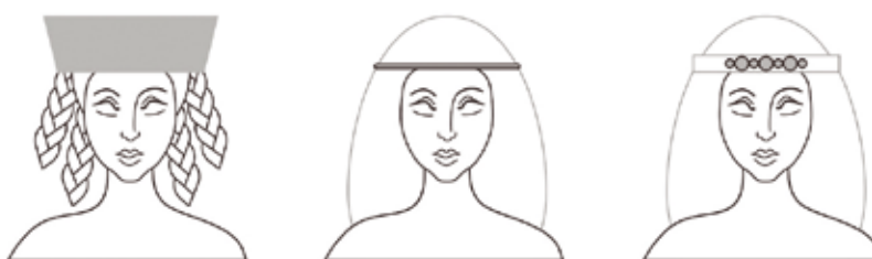
фиг. 14. Предполагаеми раннобългарски женски забраждания: трапецовидна шапка; диадема-обръч; прочелник.

В заключение, колкото и ценен източник на информация да е Светославовият Изборник сам по себе си, по отношение на българското светско средновековно облекло той е слабо информативен. В ктиторската миниатюра, двата главни персонажа са облечени по византийски маниер, като става дума за аристократични, а не за владетелски костюми. Усвояването на византийска мода при висшата аристокрация е еднакво характерно за България и за Рус след покръстването. За българска реалия могат да се приемат кафтаните на останалите мъжки персонажи, но само защото те са известни и от други изображения. На тази