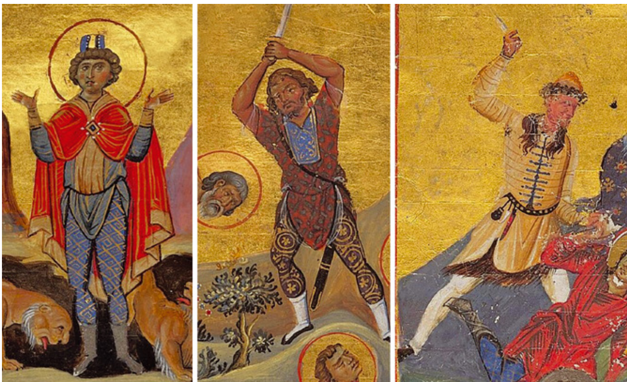
фиг. 12. Фигури в персийски костюми от Менология на Василий II: пророк Даниил; мелитински палач; българин.

както за изобразяване на библейски персонажи, така и при илюстриране жития на светци, които трудно могат да се свържат с Изтока 17 (фиг. 12). С подобни дрехи са и сражаващите се персонажи с животински маски (вероятно изобразяващи варвари) от вече споменатите фрески с увеселения в Киевския събор. Съответно напълно е възможно изображението на Стрелеца да е дословно копирано от оригинала, но трудно биха могли да му се припишат етнически характеристики, български или други.